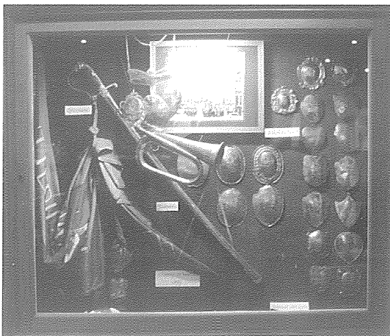
Schutterskast in Château St. Gerlach met het oudste schutterszilver van St. Martinus